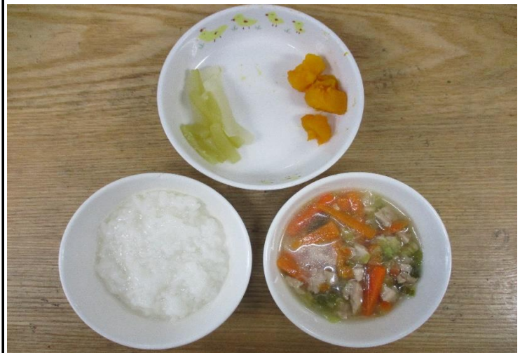
【離乳食】 鶏肉のうま煮・南瓜の塩焼き・胡瓜の和え物