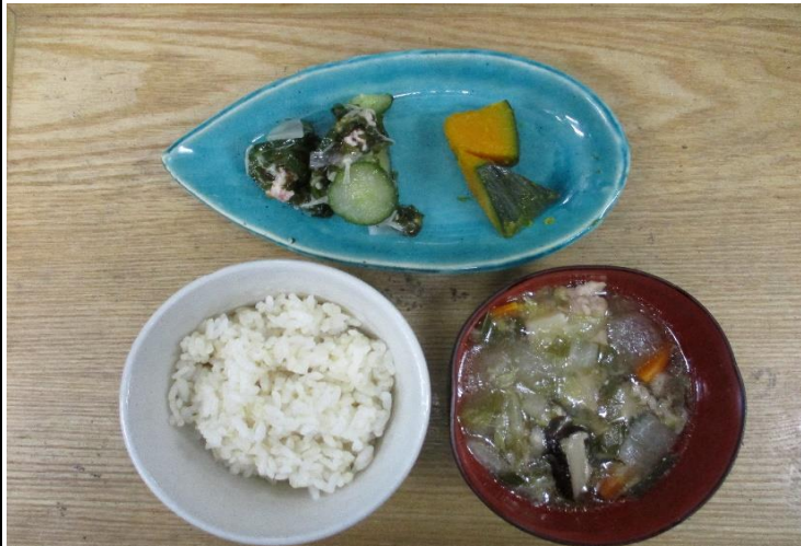
【普通食:以上児】 冬瓜と鶏肉のうま煮・南瓜の塩焼き・たこと胡瓜の酢の物

今日はたこについてです。たこはオスとメスで吸盤に違いがあり、吸盤の大きさが揃っているのがメス、まだらなのがオスです。また、日本はタコの消費量が世界一です。