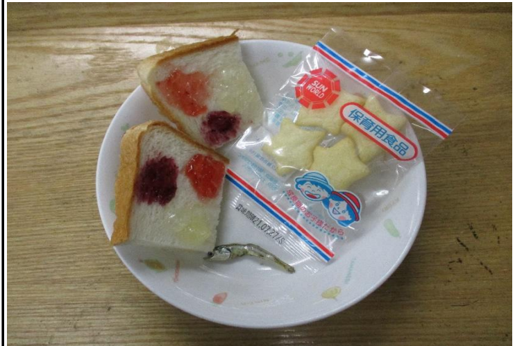
【おやつ:以上児】 パン@いろいろジャム・炒りじゃこ・お菓子